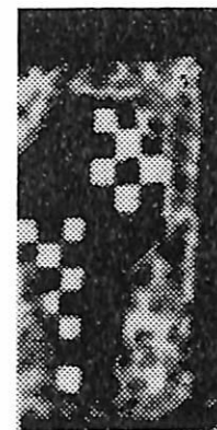
Stemma della famiglia Scacco