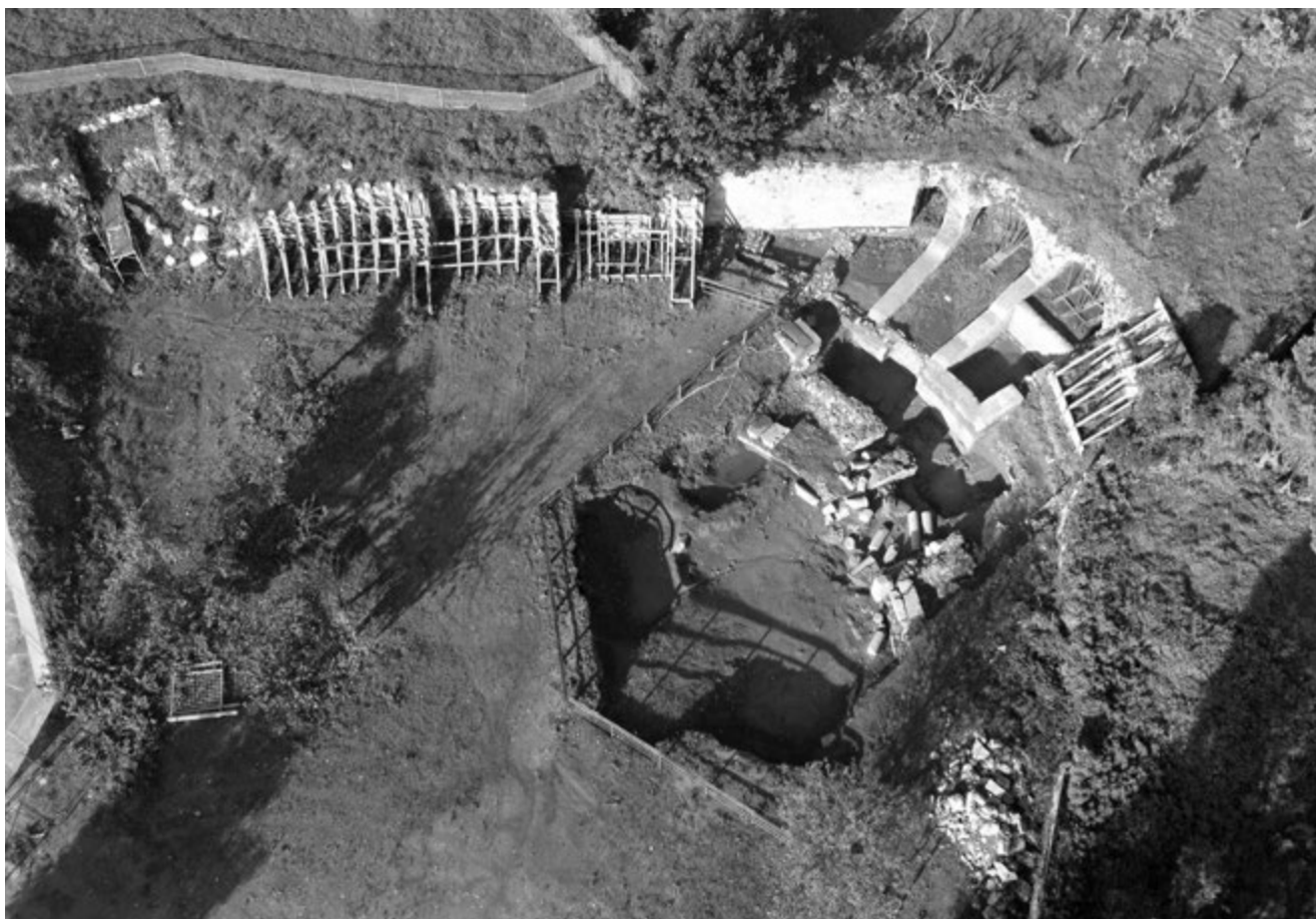
Fig. 6. Formia, anfiteatro. L'area oggetto di indagine al termine dei lavori (foto aerea).

L'ambiente B, ripartito trasversalmente in due vani (B-B 1 ) da un setto murario in reticolato, è stato svuotato completamente del suo riempimento, ma per ragioni di sicurezza soltanto nella porzione sud (B 1 ) 8 . Qui lo scavo ha in primo luogo accertato la presenza, ad un livello più superficiale, di uno spesso