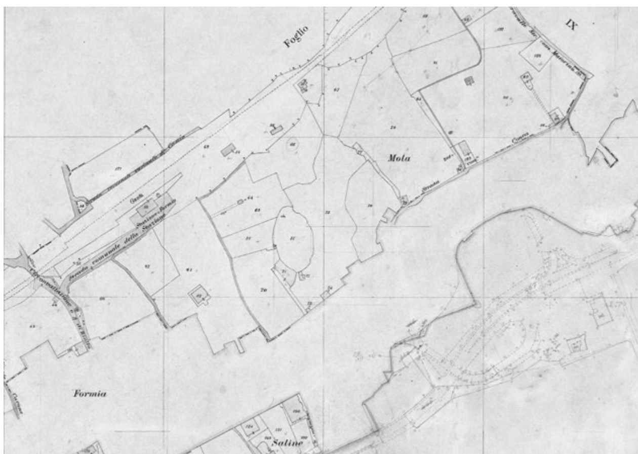
Fig. 1. Catasto urbano di Formia (1976), f. XII. Dettaglio relativo alla zona dell'anfiteatro

dall'Aurigemma 2 circa il rinvenimento di ruderi, con ogni probabilità pertinenti all'edificio ludico, intercettati negli anni Cinquanta del secolo scorso durante la realizzazione di una strada di collegamento tra via Lavanga, che ricalca il tracciato dell'Appia intra moenia , e la stazione ferroviaria; a quelli si aggiungono altri elementi murari antichi inglobati in una