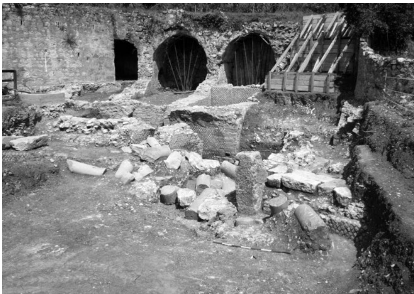
Fig. 9. Formia, anfiteatro. L'area dell'ingresso al termine dello scavo (vista da sud-est).

L'importante risultato conseguito in questa prima campagna di scavo ha spinto l'anno successivo ad approfondire l'indagine proprio nell'area dell'ingresso settentrionale (fig. 10): qui un ulteriore saggio ha permesso di rintracciare la quota pavimentale antica (fig. 11), costituita da un lastricato omogeneo in pietra calcarea bianca (US 139), formato da lastre di diversa lunghezza disposte a giunti sfalsati e in file parallele orientate lungo l'asse di percorrenza del vano. Al disopra della pavimentazione, rinvenuta in ottimo stato di conservazione, è stata individuata una sequenza stratigrafica composta – a partire dall'alto