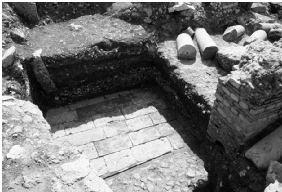
Fig. 11. Formia, anfiteatro. La pavimentazione a lastre evidenziata nell'area dell'ingresso.

di Formiae , come dimostra il caso della grande villa di Gianola 20 , che nello stesso periodo viene arricchita con ritratti e sculture tuttora in corso di studio.