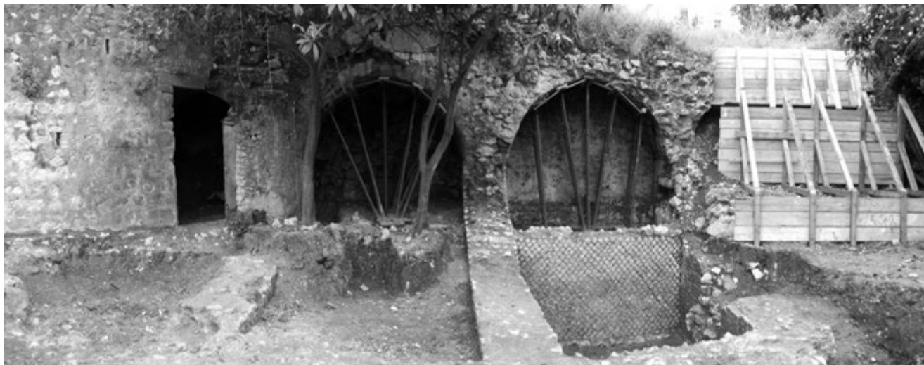
Fig. 4. Formia, anfiteatro. Gli ambienti radiali (A-B-C-D) individuati nel corso della pulizia preliminare.

calcare alternato a due filari di laterizi, e specchiature in opera reticolata con cubilia di cm 7-9 di lato. Le strutture – in parte riutilizzate come sostruzioni di un agrumeto – sono risultate emergenti dal terreno per alcuni metri di altezza, ma soltanto per il tratto più a ridosso del pendio. In particolare, il vano A appariva completamente interrato fino al culmine della volta, mentre i vani B, C e D erano ancora praticabili; questi ultimi presentavano segni evidenti di rimaneggiamenti di età post-classica, che tuttavia avevano alterato solo in parte le strutture murarie antiche, ancora ben apprezzabili già dopo una pulizia sommaria. Tali interventi, consistenti in tamponature e fodere, sono collegati al riutilizzo dei vani come locali di servizio, quasi certamente avvenuto in concomitanza con la costruzione del lungo muro di contenimento munito di contrafforti, individuato sul limite nord-ovest del cantiere e connesso alla trasformazione dell'area a