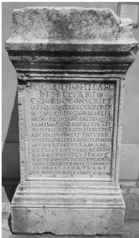
Fig. 2. Iscrizione con dedica a C. Clodius Biselliarius (Museo Archeologico Nazionale di Formia, esterno).

cantina e in un giardino annesso a un adiacente caseggiato moderno. D'altra parte l'esistenza di un edificio anfiteatrale nel florido municipium romano di Formia era ipotizzabile sulla base di alcune iscrizioni, la prima delle quali è un titulus pictus pompeiano di età claudio-neroniana (CIL IV, 1184), che annuncia un combattimento a Formiae della nota familia gladiatoria di Festius Ampliatus , forse svoltosi in un anfiteatro poiché nel testo viene esplicitamente menzionata la presenza di vela per proteggersi dal sole 3 . A questa si aggiungono altri due documenti epigrafici: la base onoraria CIL X, 6090, dedicata durante la piena età adrianea a L. Villius Atilianus che fu curator muneris publici gladiatorum 4 , e una seconda, scoperta nel 1921, incisa su una base di statua eretta in onore di C. Clodius Hilarus (fig. 2), potente liberto che – in segno di gratitudine per il bisellium che gli era stato conferito – fu editor di un munus gladiatorio verso la metà del II secolo 5 . Tuttavia, ad esclusione dei pochi