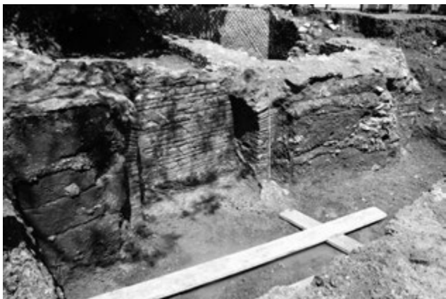
Fig. 7. Formia, anfiteatro. L'ambulacro H nel corso degli scavi (vista da sud).

Una stratigrafia con caratteristiche simili ma molto più articolata si è potuta osservare anche all'interno del breve tratto di ambulacro indagato (H) 13