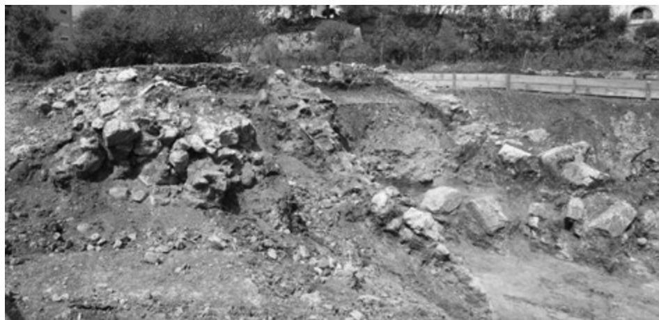
Fig. 5. Formia, anfiteatro. Gli ambienti radiali (F e G) rinvenuti sul limite nord-ovest dell'area di cantiere.

Nel corso degli stessi lavori sono stati individuati, sul limite nord-ovest dell'area, i resti di altri due ambienti radiali contigui (F e G), larghi circa m 3,50 (fig. 5). Conservati per un'altezza superiore all'imposta della volta di copertura, ancora ben visibile, entrambi i vani risultavano colmati fin quasi alla sommità da una sequenza stratigrafica, depositatasi verosimilmente in epoca antica, formata da sedimenti limo-argillosi mescolati a materiale edilizio, che sigillavano uno spesso strato di crollo contenente, oltre a porzioni di nucleo murario, anche numerosi blocchi parallelepipedi e schegge lapidee di grandi