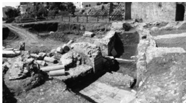
Fig. 8. Formia, anfiteatro. Ambulacro H e area dell'ingresso al termine dello scavo (vista da nord-est).

Una situazione del tutto diversa è stata invece individuata in prossimità e in corrispondenza dell'in-