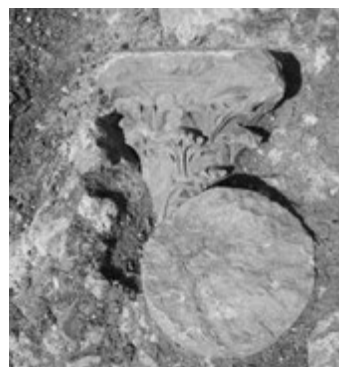
Fig. 12. Formia, anfiteatro. Capitello corinzio di tipo asiatico dall'area dell'ingresso in fase di scavo.

Jones) 23 e di supporre la presenza di un terzo anello di ambienti radiali e, di conseguenza, di un secondo deambulatorio più esterno. Nessuna ipotesi invece si può formulare sull'elevato, per il quale possediamo solo pochi ed incompleti indizi, né riguardo alle vie d'accesso al monumento, certamente condizionate dalle caratteristiche plano-altimetriche del sito soprattutto nel lato nord, addossato al pendio collinare. In assenza di assicurazioni circa l'ordinaria manutenzione degli scavi e considerata la problematica