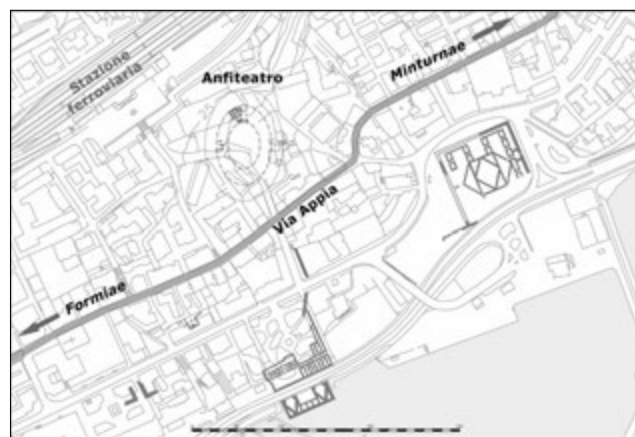
Fig. 3. Formia, stralcio del catasto urbano attuale con posizionamento delle strutture dell'anfiteatro.

Tuttavia sulla base di queste esigue notizie il monumento si trova correttamente posizionato dalla bibliografia 6 nella depressione a valle della stazione ferroviaria, corrispondente ad una zona immediatamente suburbana a nord-est dell'abitato antico (fig. 3), ancora libera da costruzioni e facilmente raggiungibile sia via mare, sia tramite la viabilità principale: posizione per altro strategica anche per motivi di ordine pubblico, considerato il grande richiamo che gli spettacoli spesso esercitavano nei territori contermini.