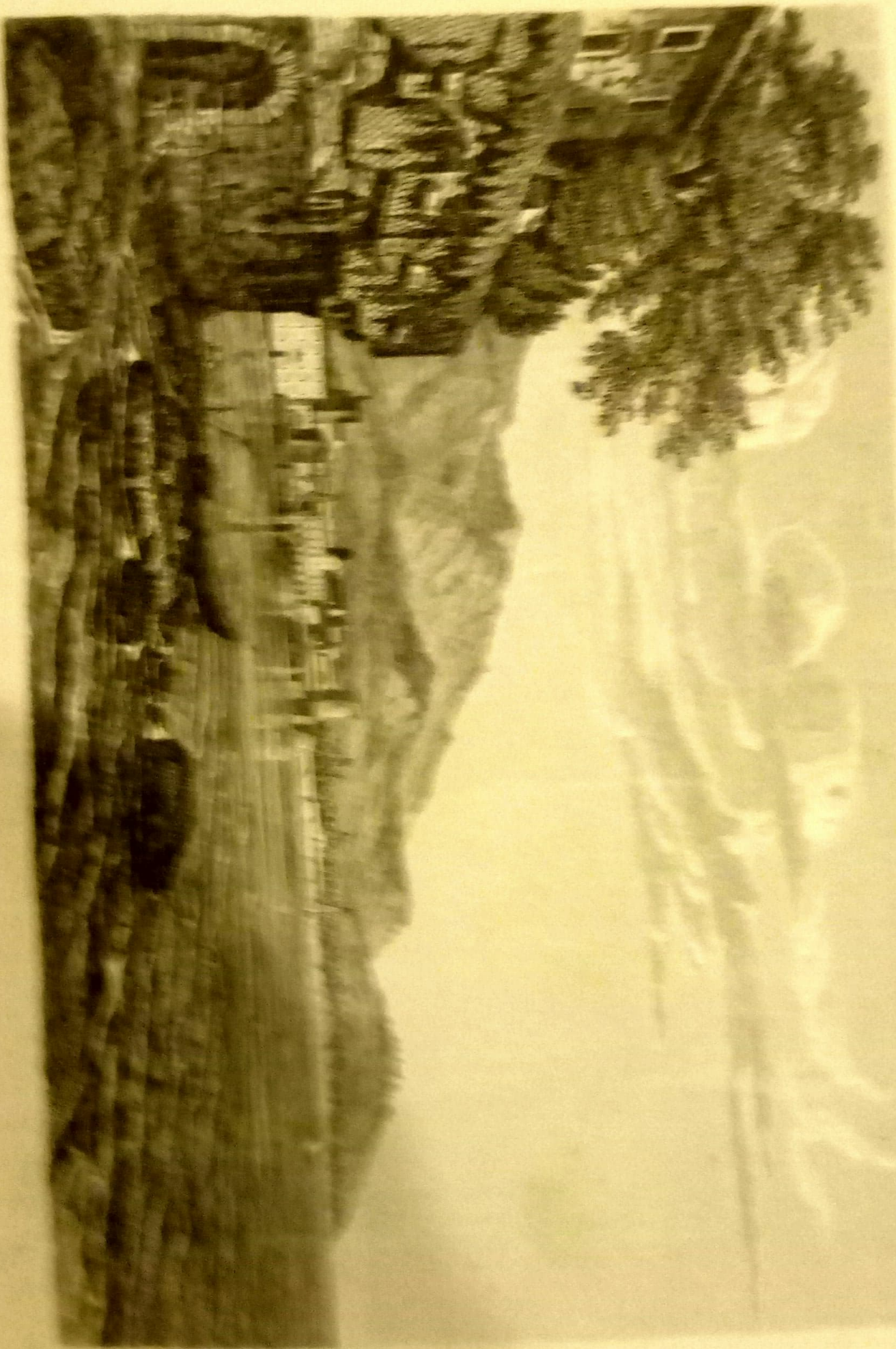
CAJALICOMA Mirador de Chalco