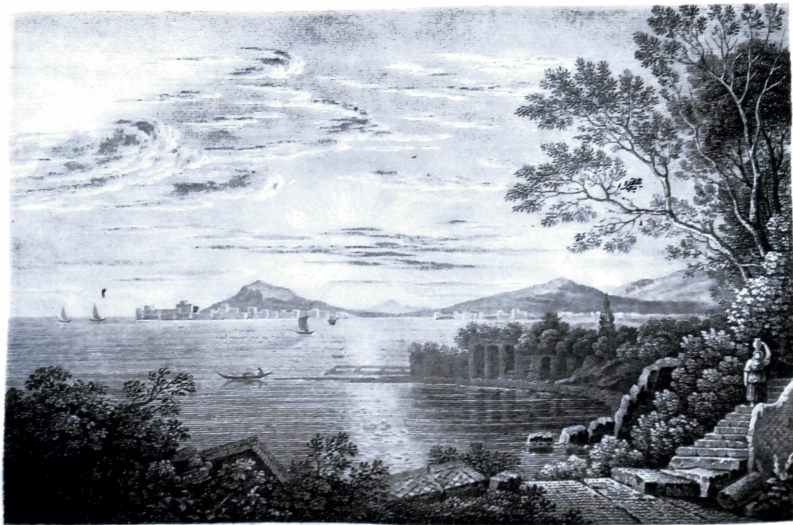
CAJETAE ARX. Cittadella di Gaeta.